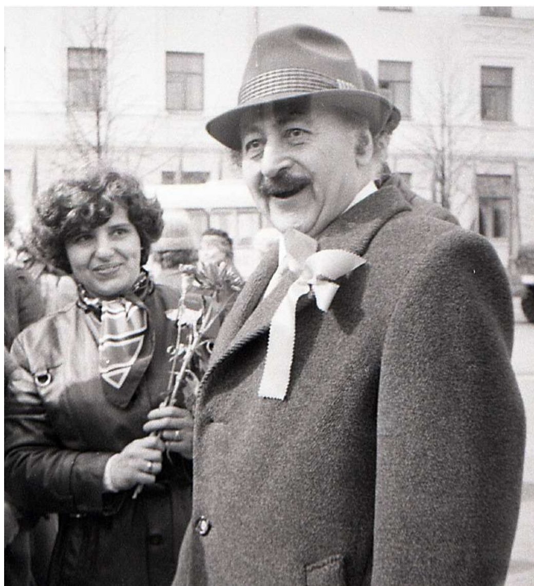
Неопубликованный снимок Гавриила Абрамовича Илизарова из архива Центра Илизарова