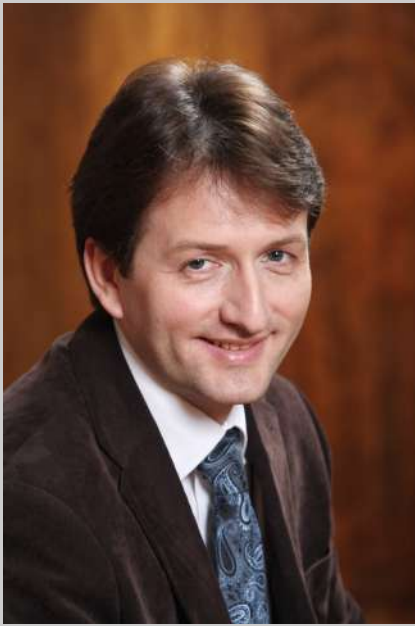
Директор ФГБУ «РНЦ «ВТО» им. акад. Г.А. Илизарова» Минздрава РФ, д.м.н.

Новый рабочий год в Центре Илизарова отмечен началом реформы клинических отделений ортопедического центра. Реструктуризация проведена для приведения в соответствие с реальным положением дел профиля отделений, логичного их расположения, удобства для пациентов, медицинского персонала и научных сотрудников. Упростилась система управления. Расположение отделений стало более логичным. Появилось больше мотиваций для развития у большинства специалистов.