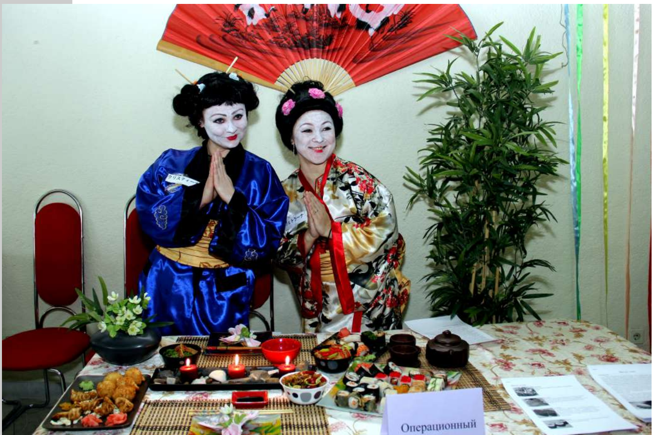
С праздником, Милые дамы!